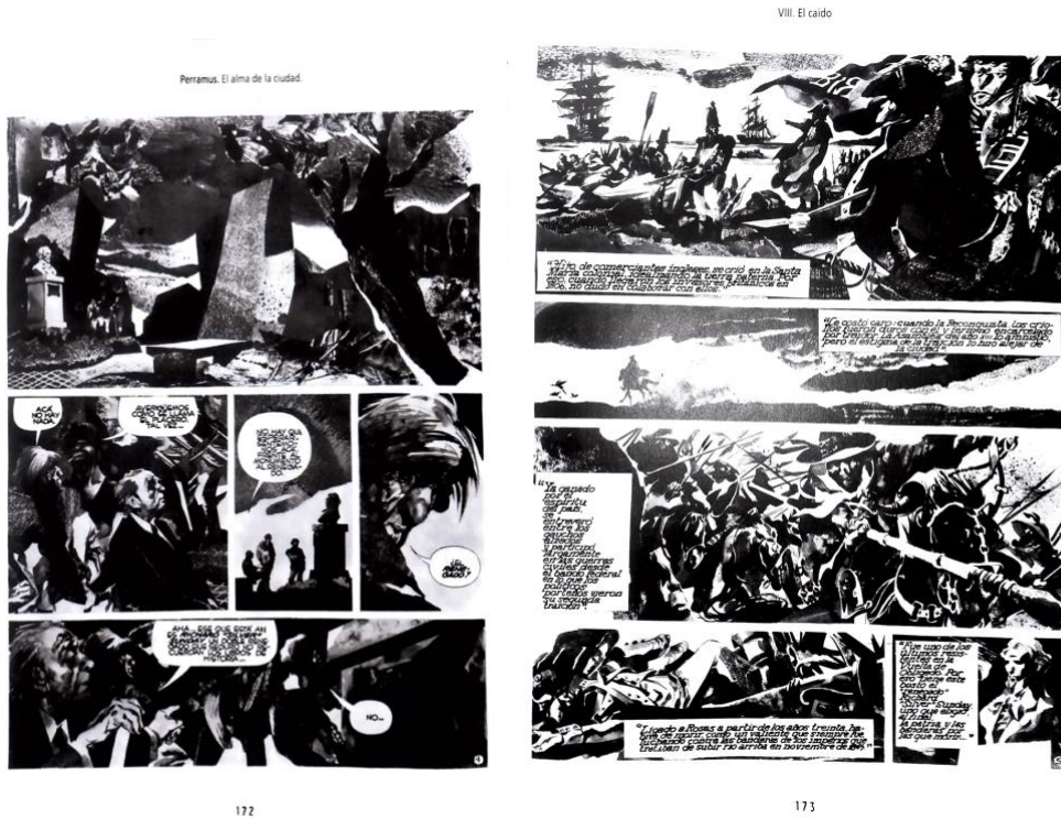
Figura 2. 8 y Figura 2. 9. Dos páginas de la historieta Perramus . La primera ilustra el momento en que el grupo de amigos llega a la plaza en donde encuentran el monolito del traidor. La segunda página ilustra y describe, como en un texto de historia, las batallas en las que participó el traidor del siglo XIX. Acuarelas en blanco y negro.

nuevamente las tensiones entre ficción y realidad que se han ido trabajando en el resto de la historieta.