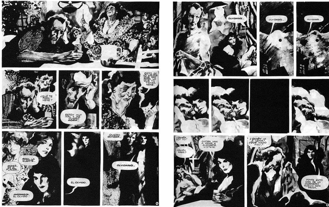
Figura 2. 2 y Figura 2. 3. Dos páginas de la historieta Perramus . En la primera página se ilustra al protagonista sentado en el bar “El Aleph”, donde una mujer le ofrece tres posibilidades asociadas a tres mujeres: la suerte, el placer, el olvido. La segunda página ilustra la relación amorosa entre Perramus y Margarita, la mujer asociada al olvido, y el momento en que el olvido se produce. Acuarelas en blanco y negro

Pero el burdel no sólo actúa como el inverso de un Aleph, pues tanto El Aleph como Perramus comparten la tematización sobre la memoria y el olvido. Para Borges, olvidar, seleccionar, sintetizar es de hecho fundamental no solo para el ejercicio cognitivo sino también estético. Borges -personaje- primero decide olvidar el indeseado encargo de Daneri de conseguir que un escritor conocido redacte el prólogo para su poemario “La tierra”. Decide olvidarlo porque no le gusta y no le interesa. “La tierra” es un poemario aglutinador como un Aleph; de hecho, surge como fruto de las sucesivas visiones que el poeta tiene del prodigio, y en él se propone nada más que describir “toda la redondez del planeta” (1063). En la empresa enorme y tediosa de Daneri, enumera y describe en largos e informes versos alejandrinos paisajes que van desde Australia hasta Veracruz. Una vez que Daneri lee y explica detenidamente algunas estrofas del poema,