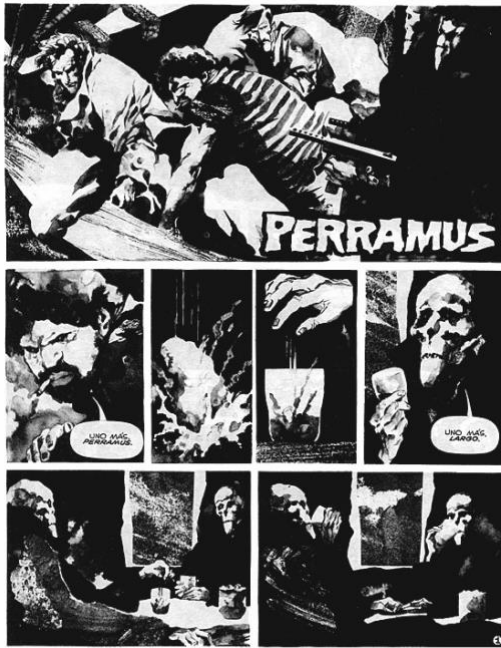
Figura 2. 5. Página de la historieta Perramus . El Primer panel del ancho de la hoja muestra a Perramus y Canelones arrojando cuerpos al mar. Las dos series de paneles de abajo ilustran a dos agentes del mal con rostros de calavera tomándose un trago, sentados frente a frente en una mesa. Acuarela en blanco y negro.

brevemente sólo en la primera página del segundo capítulo “En el fondo del mar”, en donde la cuidada selección de elementos y la limitación espacial a través de calles, está destinada a expresar las complejidades de ser un sobreviviente durante la dictadura.