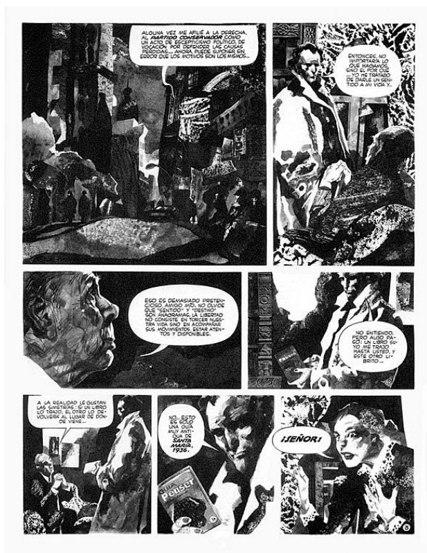
Figura 2. 7. Página de la historieta Perramus . Aquí se ilustra una conversación entre Borges y Perramus en la casa de Borges. Acuarela en blanco y negro.

vida y...”, le dice Perramus a Borges citando el anagrama entre “sentido” y “destino” citado más arriba.