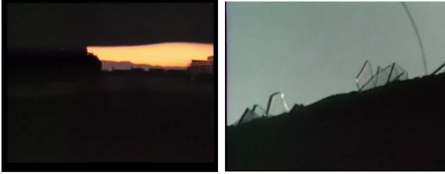
Figura 1. 8 y Figura 1. 9. Dos tomas del documental “La Flaca Alejandra”, que reproducen la mirada Marcia Merino cuando fue detenida. En la primera imagen se ve un segmento de un atardecer, bloqueado por una visión vendada. La segunda muestra la visión de un muro cuyo borde tiene incrustado pedazos de vidrios y alambres de púas.