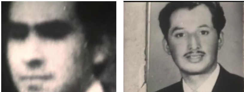
Figura 1. 4 y Figura 1. 5. Dos Tomas del documental “La Flaca Alejandra”, de dos fotografías en blanco y negro de detenidos desaparecidos. La primera es la imagen borrosa del rostro de un hombre blanco. La segunda toma muestra el rostro de un hombre blanco de bigotes que posa a una cámara sonriendo.

dimensión escritural que se repite en su producción cinematográfica. En diálogo con la narración en off de Castillo aparecen como “huellas dispersas” una serie de fotografías de detenidos desaparecidos, que por una parte señalan una fijación en el tiempo – “inmóviles en estas fotos” dice Castillo – pero que, por otra, se mueven sin poder detenerse, enfocándose y desenfoándose.