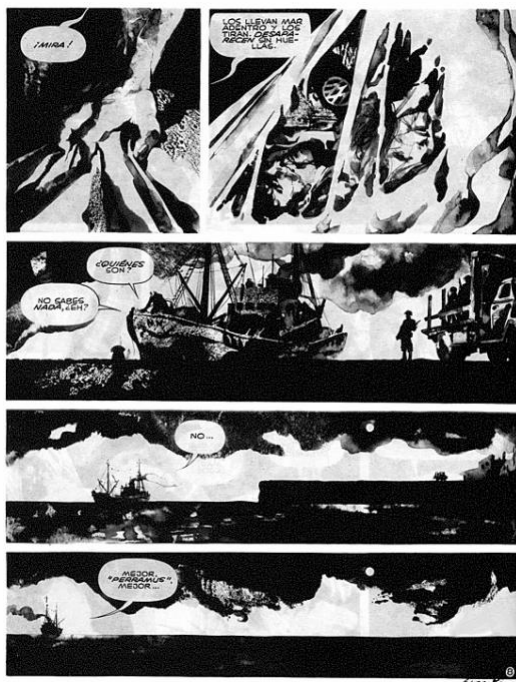
Figura 2. 4. Página de la historieta Perramus . La primera serie de paneles muestra cuerpos envueltos en una bolsa. Los tres paneles inferiores, del ancho de la página, muestran la visión de un barco que se va alejando en altamar, del que salen globos de texto con el diálogo que sostienen Perramus con Canelones. Acuarela en blanco y negro.

La complicidad tanto de Canelones como de Perramus en la desaparición de los cuerpos tematiza el trabajo humano implicado en las tareas de ejecución y de desaparición de los cuerpos durante la dictadura, esta vez ejecutado nada menos que por los héroes de la historieta. El producto de este trabajo no es crear un bien material, una mercancía como en el caso de la chaqueta de lino, sino más bien desaparecer la materia, el cuerpo. Esta secuencia de imágenes muestra cómo la muerte y la desaparición están en el centro del modo capitalista de producción: la muerte es lo que produce el capitalismo, en su lógica de producción de valor, pero también la muerte es lo que permite que el capital permanezca intocado, en tanto eran estos cuerpos los que amenazaban su sistema de producción. El bien inmaterial que este trabajo produce es el olvido, la borradura del cuerpo y de la memoria del cuerpo. “Los llevan mar adentro y los tiran. Desaparecen sin huella” (22), dice Canelones. El detalle de los cuerpos en el primer panel, en contraste con la pequeñez del barco en la inmensidad marina, llama la atención sobre la imposibilidad de que los