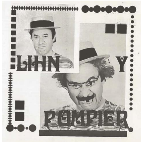
Figura 3. 1 Imagen del libro Lihn y Pompier , en la que se convinan dos fotografías del autor. La imagen situada al frente, de menor tamaño, aparece Lihn con un sombrero y el ceño fruncido. Sobre esta imagen se lee LIHN. La segunda imagen, de mayor tamaño y ubicada atrás, aparece Lihn con el mismo sombrero, pero esta vez con lentes, bigotes, y un diente pintado de negro. Su expresión es desafiante y de enojo. Sobre esta segunda imagen está escrito Y POMPIER.

Un personaje similar a Pompier es el famoso Tetas Negras, el energúmeno protagonista de los “sonetos del energúmeno” de Por fuerza mayor , publicado en España 1975. El Tetas Negras es un torturador y poeta sonetista, que busca “hacer en paz la guerra a medio mundo” (21). Utilizando el mecanismo satírico similar que utiliza con Pompier en el que asume el lenguaje del poder, Lihn hace distintas asociaciones entre lenguaje y tortura. Por una parte está la elección del soneto como el lenguaje del torturador, que se puede pensar en sus distintas implicancias sobre la violencia del lenguaje. Primero como instrumento de dominación, en tanto el soneto es, durante el genocidio de las Américas, parte del canon literario con el que viaja y coloniza el imperio español. Pero también el soneto es una pequeña máquina de tortura por las estrictas reglas que rigen su construcción. Por otra parte, será el hablante del soneto mismo un torturador. En versos como “a mal entendedor, Quebrantahuesos” existe una referencia directa al poeta como aquel que quiebra los huesos a quien no entiende, a la vez que hace un juego de palabras con los “Quebrantahuesos”, que fueron prácticas poéticas realizadas por Lihn junto a Nicanor Parra y Alejandro Jodorowsky durante los años 50’s. Tanto el Tetas Negras como