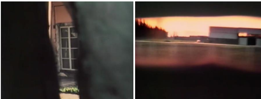
Figura 1. 10 y Figura 1. 11. Dos tomas del documental “La Flaca Alejandra”, que reproducen la mirada Marcia Merino cuando fue detenida, y que está bloqueado por una visión vendada. La primera imagen es el fragmento de una casa, mientras la segunda muestra la imagen de una calle capturada mientras se está en movimiento.

Junto con Mary Jean Treacy, hay un conjunto crítico que lee la producción testimonial y documental de Carmen Castillo como la demanda de una memoria cultural alternativa, que se ha mantenido al margen de cualquier juicio a la debilidad bajo la tortura: Alba Stacey Skar, a quien ya mencioné, indica que “Quizás Carmen Castillo es la que mejor ha advertido y evitado los peligros de juzgar a prisioneros que colaboraron bajo tortura” (287), Ignacio Albornoz resalta