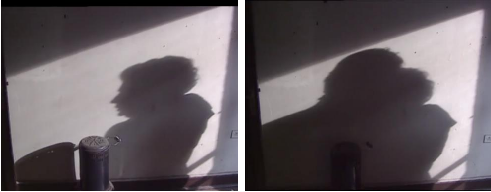
Figura 1. 6 y Figura 1. 7 Dos tomas del documental “La Flaca Alejandra”, que aparecen la proyección de las sombras de Marcia Merino y Carmen Castillo proyectadas sobre un muro.